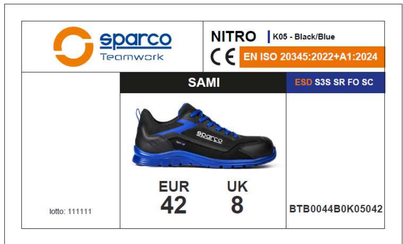
ETICHETTA ESTERNA SCATOLA applicata sul lato predisposto della scatola, riporta le caratteristiche del prodotto, Certificazione, numero di lotto, codice prodotto, codice QR e codice a barre. Dimensioni 105x60 mm