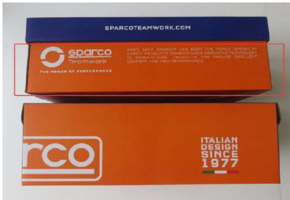
SCATOLA SCARPE SPARCO TEAMWORK BICOLOR in cartone blu-arancio e carta velina interna protettiva. Indicazioni per il riciclo valide per l'ITALIA sul fondo (PAP20)