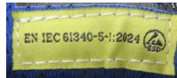
ETICHETTA "CE" INTERNA all'interno della linguetta Dim. 50 x 15 mm + etichetta ESD