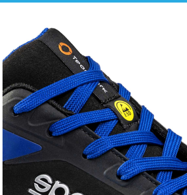
Etichetta TEAMWORK in tessuto jacquard su linguetta, Logo ESD su passalacci.