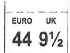
ETICHETTA TAGLIA cucita tra tomaia e linguetta Dim 17 x 14 mm