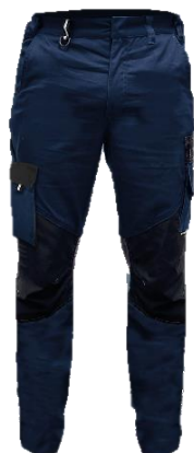
4080 BLue Navy/Black