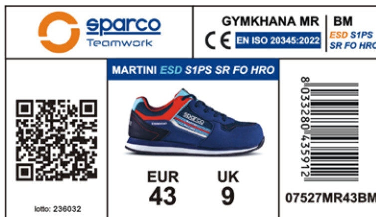
ETICHETTA ESTERNA SCATOLA applicata sul lato predisposto della scatola, riporta le caratteristiche del prodotto, Certificazione, numero di lotto, codice prodotto, codice QR e codice a barre. Dimensioni 105x60 mm