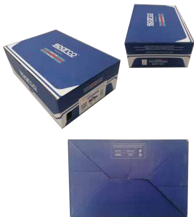
SCATOLA SCARPE SPARCO - MARTINI RACING in cartone blu-bianco + logo MARTINI RACING e carta velina interna protettiva. Dimensioni 343x188x123 mm Indicazioni per il riciclo valide per l'ITALIA sul fondo (PAP20)