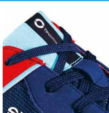
NASTRINO TEAMWORK cucito sulla linguetta (15x60 mm)