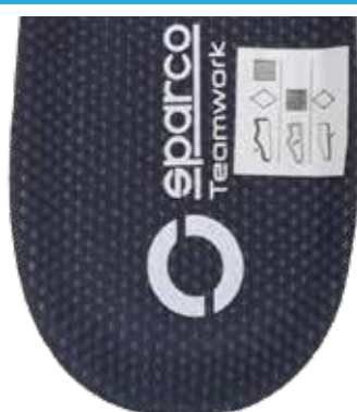
ETICHETTA DI COMPOSIZIONE applicata sulla scarpa destra Dim. 28 x 28 mm