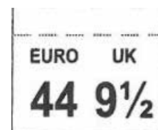
ETICHETTA TAGLIA cucita tra tomaia e linguetta Dim 17 x 14 mm