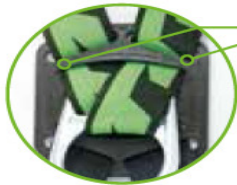
Fall indicators on the back plate for easy inspection