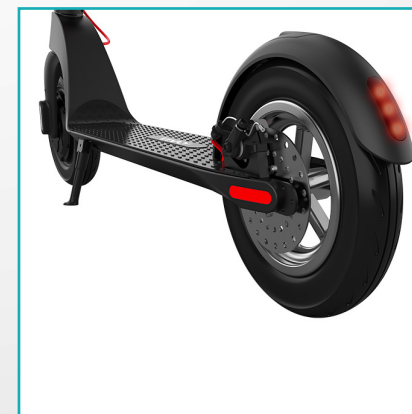
Luce posteriore LED