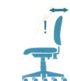
Contatto perm. evoluto