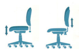
Regolazione sedile e schienale