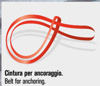
Cintura per ancoraggio. Belt for anchoring.

50.000 resistance/cycles EN 131-2: 2018 USO PROFESSIONALE PROFESSIONAL USE