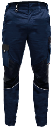
4080 Blue Navy/Black

Pantalone 6 tasche. 2 tasche ai fianchi con sacco tasca in tessuto principale. 2 tasche posteriori, di cui una chiusa con patta. 1 tasca laterale sinistra coperta con patta, con tasche porta-penne e porta-cellulare applicate. Porta-metro con tasche porta-attrezzi e porta-penne applicate. 1 tasca laterale destra chiusa con patta e secondo portametro integrato. Bottone metallico a pressione coperto. Cintura con elastico ai fianchi. Insetti in tessuto anti-abrasione e a contrasto di colore su: fondo tasche, pattine tasche, ginocchia e fondo gamba posteriore. Insetti in materiale retro-riflettente applicati su ginocchia e fondo gamba posteriore