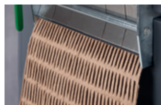
Creazione di tappetini imbottiti (HSM ProfiPack P425).